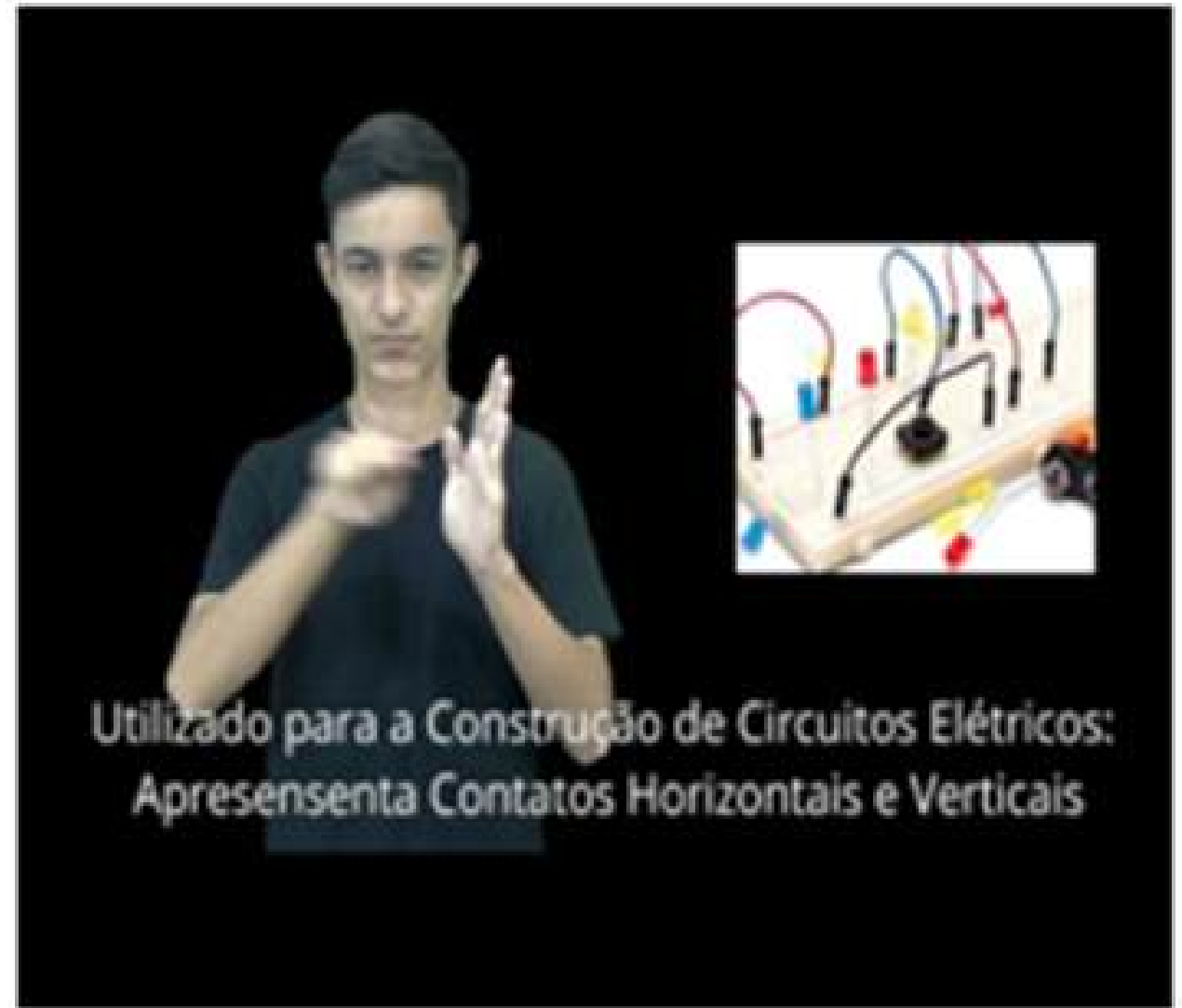
Figura 2 Resultados parciais. Disponíveis em: https://drive.google.com/file/d/1Z02pg-Js0Jhy-T2exP8hGR_GmEKI2TSQ/view?usp=sharing .