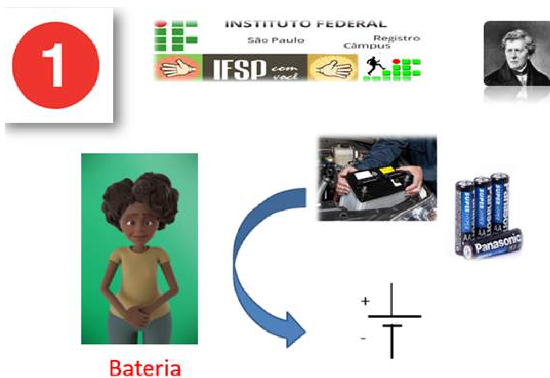
Figura 1: Etapas do projeto.