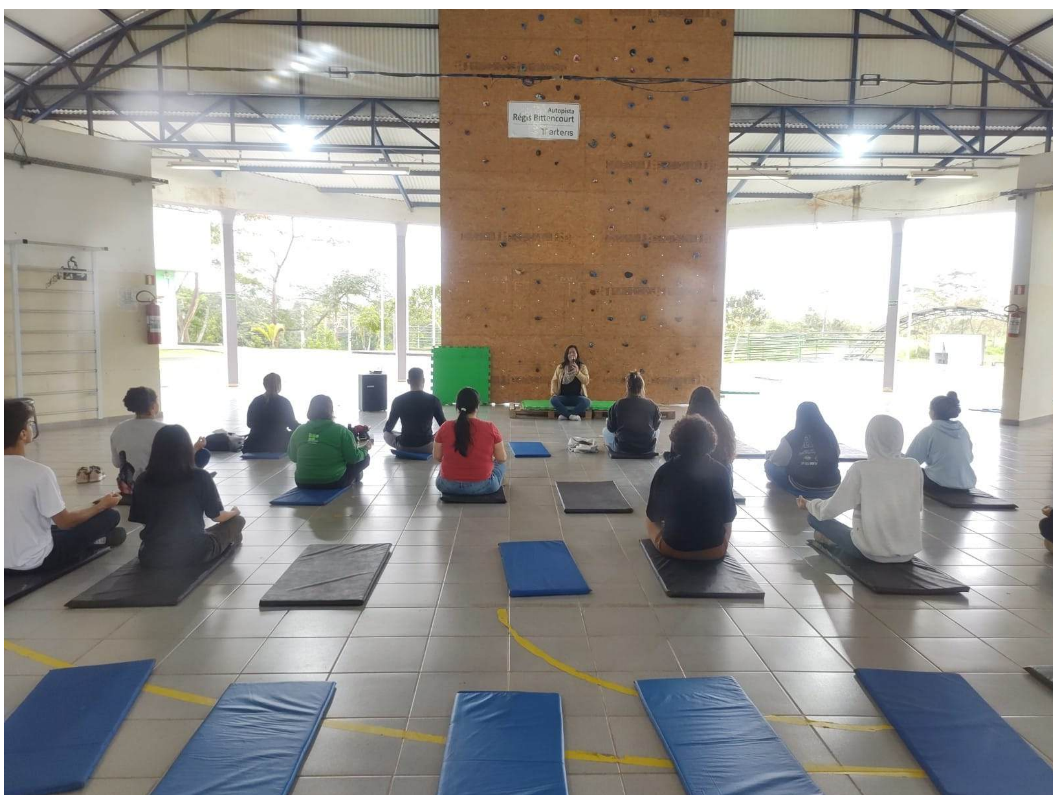
Yoga: pranayamas e meditações simples.